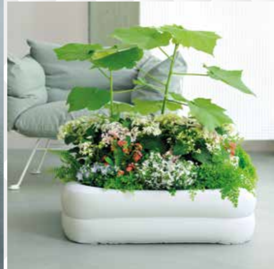
Aufblasbare Formen erinnern an softe Puffer