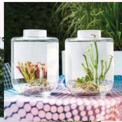
Aufregende Interaktion zwischen transparent und semi-transparent