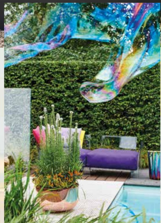
Interessante metallische und irisierende Effekte