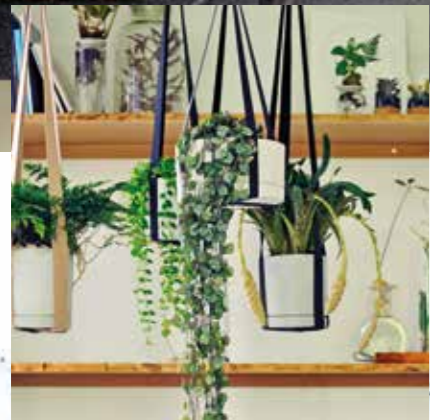
Unregelmäßige Formen und Muster