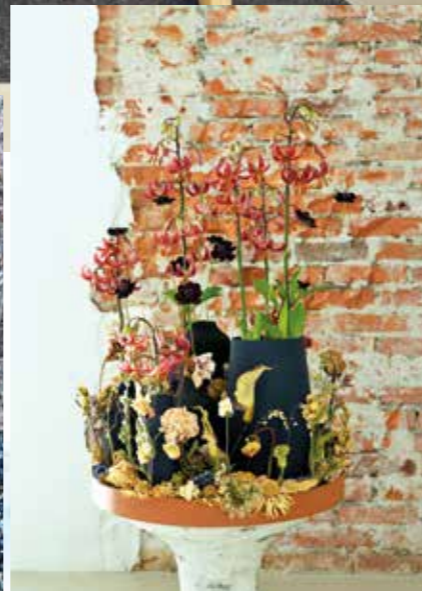
Getrocknete Blumen sind zurück