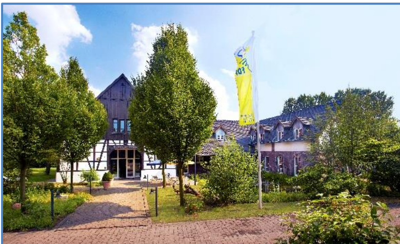
Verbands-Immobilie mit besonderem Flair Der FloristPark International in Gelsenkirchen