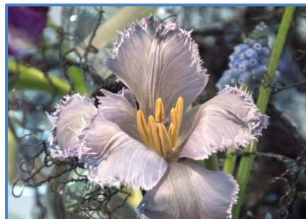
Fantastische Floralien wurden verarbeitet