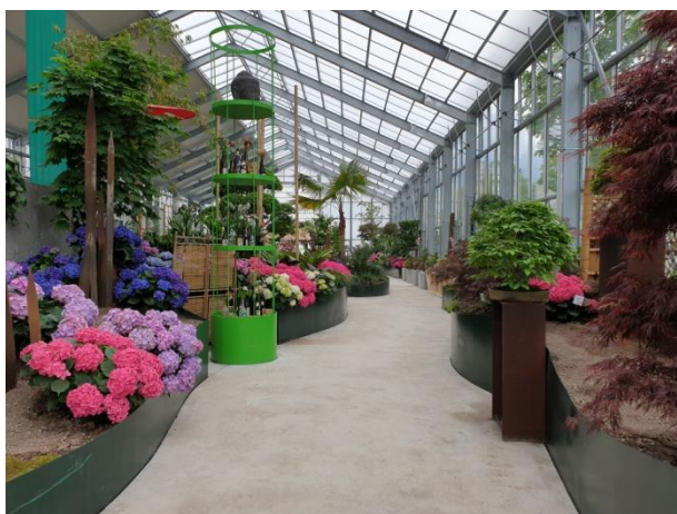
Die Blumenhalle - Austragungsort für den FDF-Floristik-Wettbewerb auf der BUGA in Erfurt