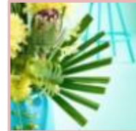
exotische Blätter und Blüten

Wie fruchtig exotische Sommer-Cocktails wirken die farbintensiven Blüten-Kreationen aus der aktuellen Kollektion just chrys 2021 und versprühen Lebens-Lust und gute Laune. Unter dem Titel Poolside Cool präsentiert das FDF-Kreativ-Team dieses Blüten-Arrangement im Retro-Look. Das scharf geschnittene Chamaerops-Blatt gibt diesem Gesteck eine klare maskuline Anmutung. Ein poppig, erfrischendes Design im Miami Vice Stil für die heißen Tage des Sommers.