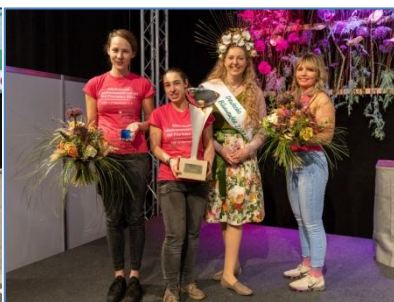
Glückliche Siegerinnen mit Blumenfee