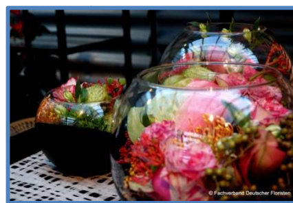
Elegante Arrangements im Trend "Equalise"