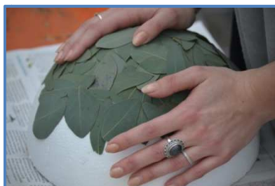
Florale Techniken wurden gezielt geübt