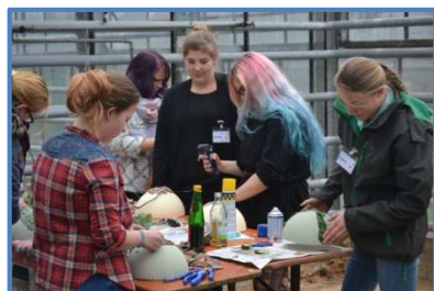
Andrang beim "Keep on Day" beim FDF Baden-Württemberg