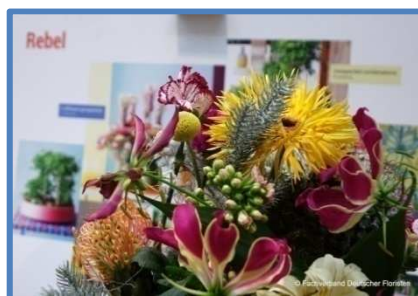
Bunt und voller Optimismus Werkstück im Trendthema "Rebel"