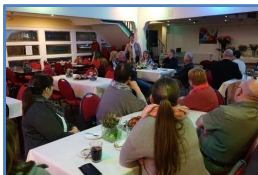
Floristen-Stammtisch im Unperfekthaus in Essen