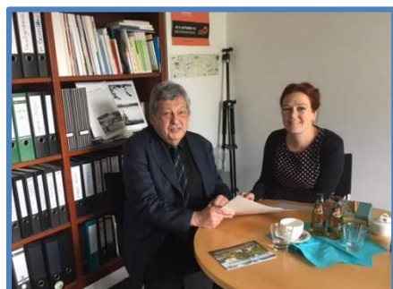
mit Katja Dörner, Bündnis 90/Die Grünen