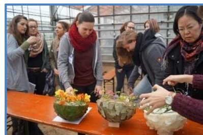
Diese Werkstücke können sich sehen lassen.